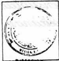
Sello de la escuela